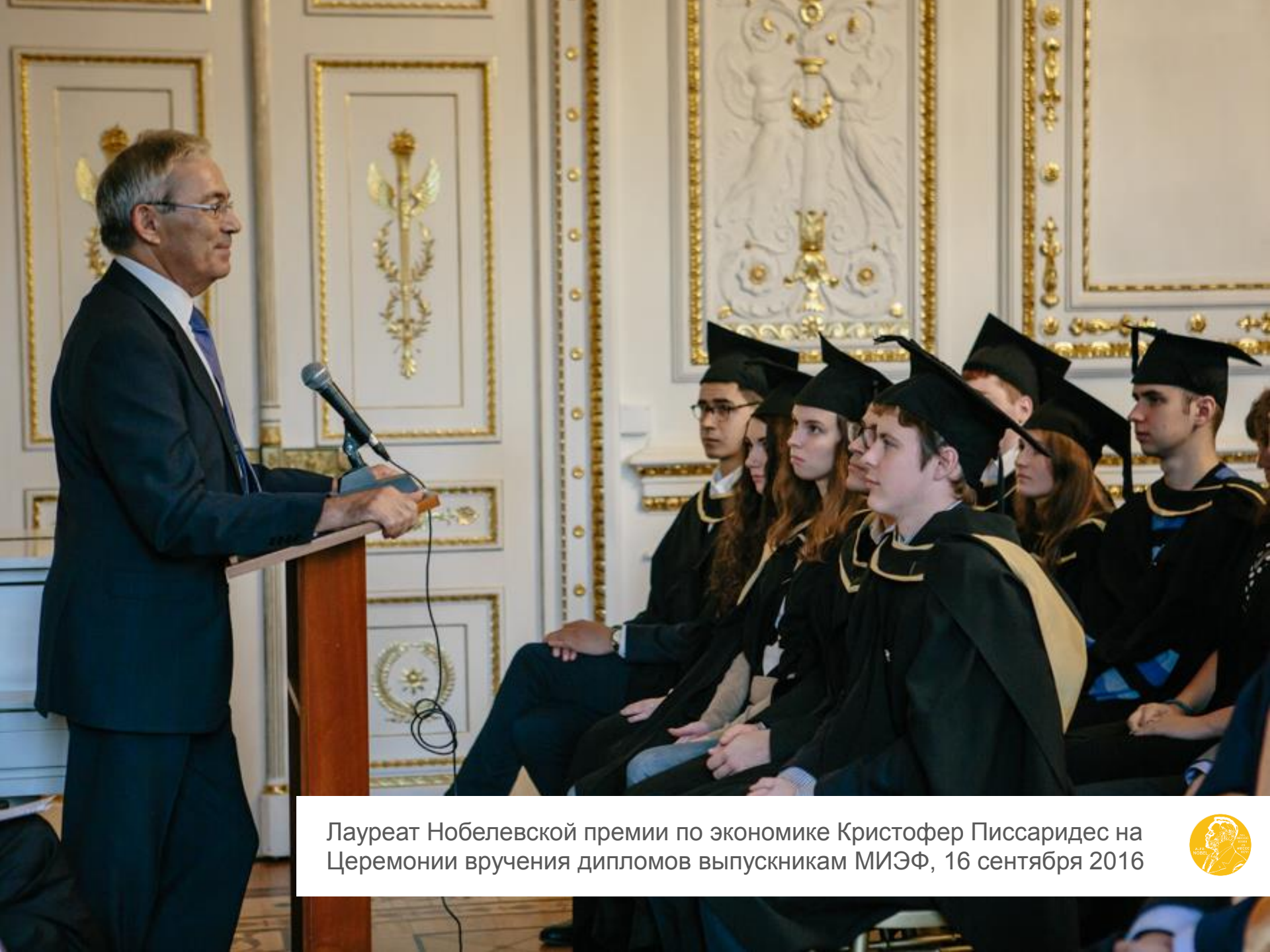
Лауреат Нобелевской премии по экономике Кристофер Писсаридес на Церемонии вручения дипломов выпускникам МИЭФ, 16 сентября 2016